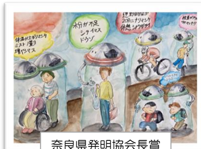
奈良県発明協会会長賞